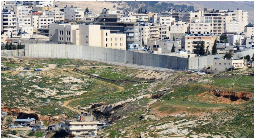
Западна обала , Палестина.

Д.С: Наблос, је на западној обали. Самарићани су познати из библијске поуке о Добром Самарићану који помаже опљачканом човеку крај пута као и из приче где Самарићанка Исусу даје воду. Данас, су то они Јевреји који су остали?